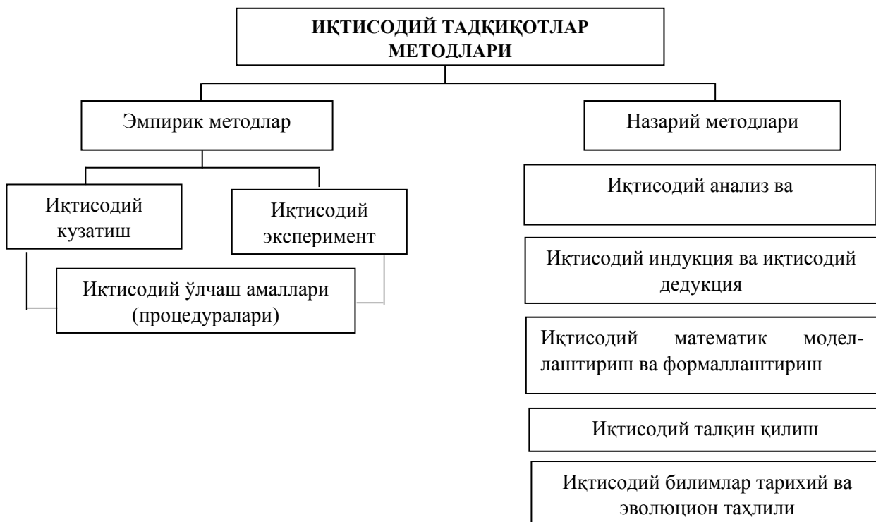
2-расм. Иқтисодий тадқиқотларнинг эмпирик ва назарий методлари

Иқтисодий тадқиқотларнинг назарий методлари илмий иқтисодий билимлар тизимининг оқилона асосланган даражасида амал қилади. Булар: иқтисодий таҳлил (анализ), иқтисодий синтез, иқтисодий индукция, иқтисодий дедукция, иқтисодий билимлар соҳасини математикалаштириш ва шаклга келтириш, иқтисодий талқин қилиш, ҳамда иқтисодий билимлар соҳасидаги тарихий ва эволюцион таҳлил (2-расм).